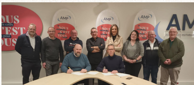
Signature de la convention de partenariat entre les AMP et la Fédération Française de Ballon au Poing.

Parce qu'au-delà de l'assurance, notre volonté est aussi de faire grandir et rayonner notre territoire .